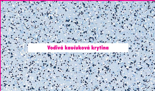
Vodivá kaučuková krytina

Osvědčenou technikou pokládání je spojení vodivé podlahové krytiny – v tomto případě kaučuku – a vodivého lepidla Thomsit K 112 . V porovnání s běžnými technikami vyžadujícími pokládání měděné mřížky, zajišťuje tento systém vodivost bez přídavných složek. Tím je zajištěna dlouhodobá trvanlivost systému pro různé kombinace vodivých podlah.