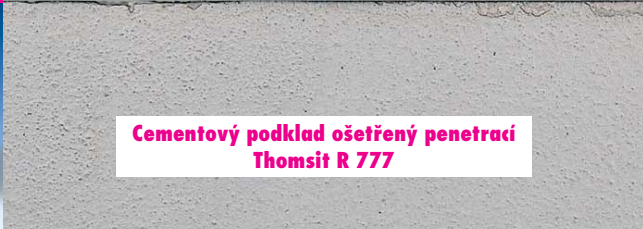
Cementový podklad ošetřený penetrací Thomsit R 777