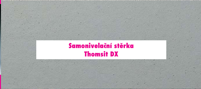
Samonivelační stěrka Thomsit DX