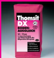
Samonivelační stěrka Thomsit DX