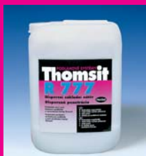
Cementový podklad natřený základním nátěrem Thomsit R 777