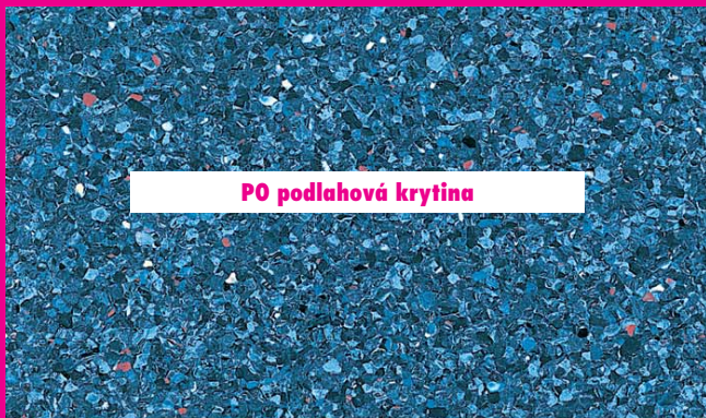
PO podlahová krytina

Krytiny na bázi polyolefinů, neobsahující PVC, jsou choulostivé na změny teploty a vlhkosti během vysychání. Následky: v budově musí převládat optimální klimatické podmínky - teplota 18 °C a přibližně 50 až 60% relativní vlhkost vzduchu.